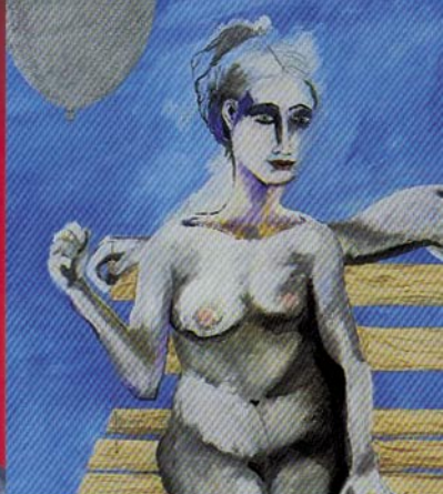
Imágenes correspondientes a obras de la colección: Arte de Mujeres, cedidas por el Instituto Andalúz de la Mujer (IAM)